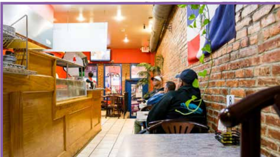
El Merengue cautiva a paladares latinos y locales.