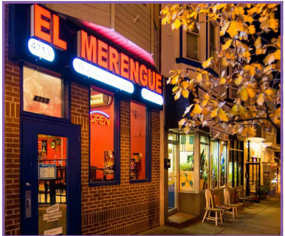
Encuentre la sazón dominicana en El Merengue de Baltimore.