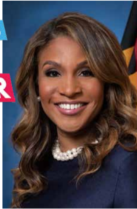
Dawn Flythe Moore, Primera Dama del Estado de Maryland.