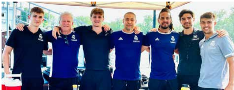
Staff de Coach de la Fundacion Real Madrid quienes dejaron una extraordinaria enseñanza en Baltimore.