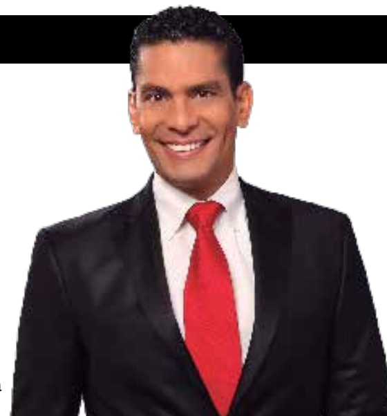
Por Ismael Cala www.Cala.Academy/ / @cala Periodista, escritor, productor, presentador de radio y televisión, autor inspiracional y conferencista

Según un estudio de University College de Londres, necesitamos 66 días para convertir un nuevo objetivo o actividad en algo automático. La investigación demuestra que no hay suficientes argumentos para determinar que en 21 días —como se creía— se pueda incorporar un hábito.