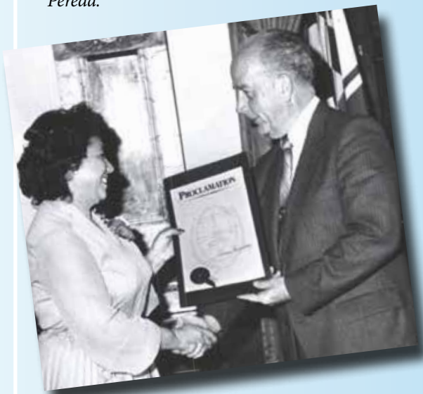
Miembra fundadora del Comité del Alcalde en Asustos Hispanos bajo el alcalde William Donald Schaefer.