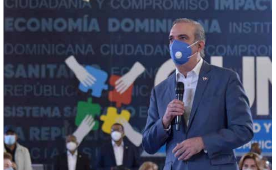
Luis Abinader, el primer presidente elegido el 5 de Julio en República Dominicana en tiempos de pandemia en Latinoamérica.

Asume el reto de dirigir un país asediado por una pandemia e inmerso en una gran crisis económica.