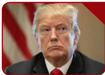
Presidente Donald Trump

El presidente Trump retiró el pasado domingo su oferta para negociar sobre el futuro de los miles de jóvenes indocumentados beneficiarios de DACA y amenazó a México con poner fin al Tratado de Libre Comercio de América del Norte (Tlcan) si no incrementa su seguridad fronteriza. “¡No más acuerdos con DACA!”, escribió en Twitter el mandatario. Esto supone un giro en la postura del presidente, pues hasta ahora había insistido en que quería una solución para los jóvenes indocumentados, conocidos como “soñadores”, y había culpado a los demócratas del bloqueo de las negociaciones. El mandatario urgió a sus correligionarios a usar la llamada “opción nuclear” para cambiar las leyes del Senado y aprobar una ley migratoria sin DACA. La llamada “opción nuclear”, que el líder de la mayoría en la Cámara