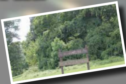
3900 Bel Air Rd, Baltimore, MD 21213.

Disfrute de un oasis urbano en el noreste de Baltimore con 375 acres de bosques que se extienden a 2.3 millas de la Morgan State University. El parque está definido por Herring Run, una bonita corriente que serpentea a través de él. Entre las actividades se incluyen, camping, observación de aves, pesca, senderismo, bicicleta, parque infantil, basquetbol, béisbol, fútbol y animados juegos