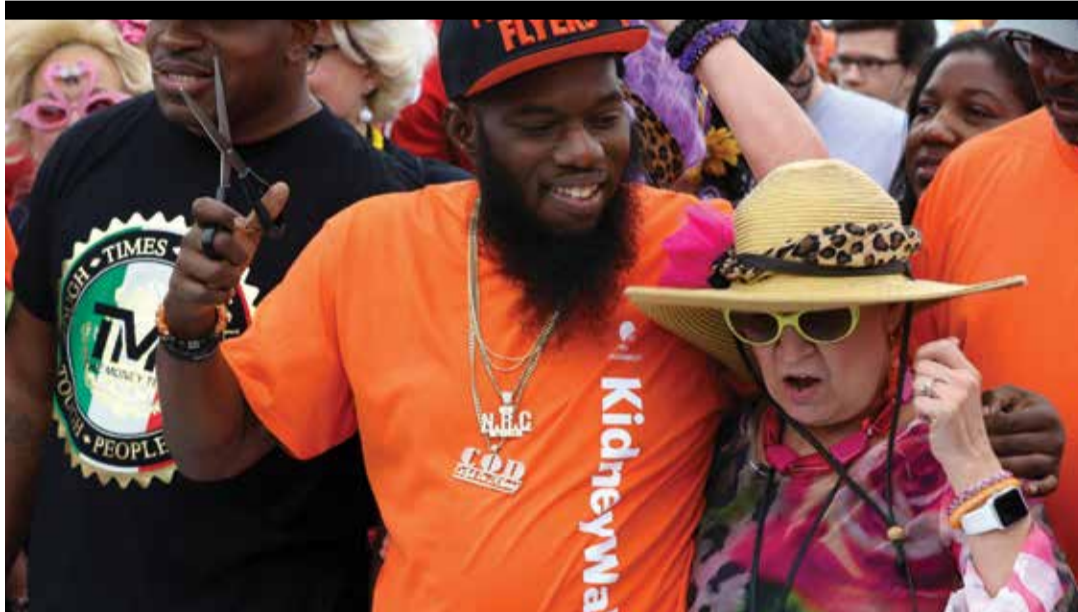
Freeway Celebrity Ambassador: Roc Nation Recording Artist Freeway

Weinberg Y in Waverly • Check in: 9am • Start Time: 10am 410.494.8545 • www.kidneywalk.org