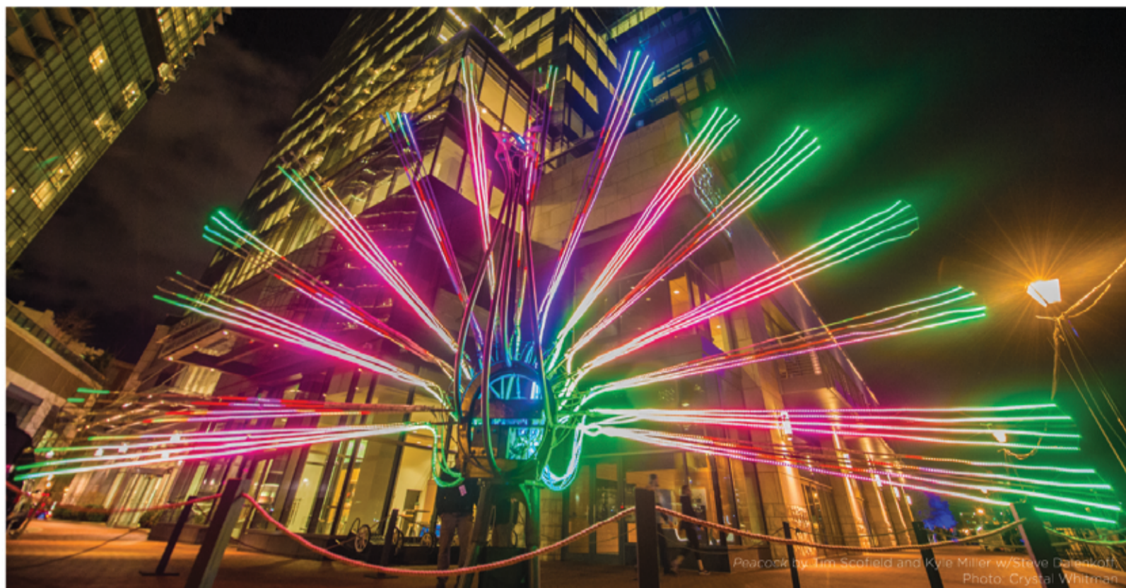
Peacock by Tim Scofield and Kyle Miller w/Steve Daterkott

BALTIMORE OFFICE OF PROMOTION & THE ARTS Arts • Events • Film