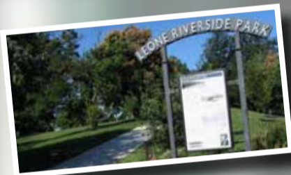
301 E Randall St, Baltimore, MD 21230.

Situado en el sur de Baltimore, entre Federal Hill y Locust Point, es uno de los parques más antiguos y únicos de la ciudad de Baltimore. Abarca más de 17 acres y sus principales recreaciones incluyen patios abiertos para la lectura, picnic, piscinas, básquetbol, un diamante de softbol, atletismo, área de juegos infantiles, senderos para trotar y áreas para eventos comunitarios y conciertos.